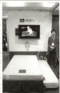
ドリームベッドの「サータ」

「スランパレード」は、1919年創立の英国ベッドメーカーで、英国王室御用達の伝統と風格のあるブランドとして世界的にその名が通っている。また、世界