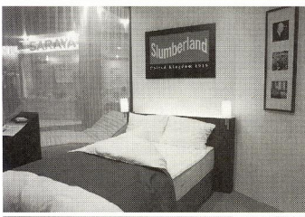
「スランパレード」の「スランパレード」富岡商店の「香月KANZUKU」

9月28日(火)〜29日(金)に東京ビッグサイトで開催された、第38回国際ホテル・レストラン・ショーは8万7千の来場者を集め幕を閉じた。出展社を