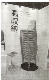
東洋工業の「ライタックフェーロ」

株式会社筑波産商は3月2日〜4日に自社ショールームで新作発表会を開催。ワイフスタイルの変化に対応した各メーカーおよび自社オリジナルブランドの最新製品群のなかから注目を集めた製品を紹介する。 株式会社HIDAK AGUの発表したヒーター付きダイニング「ステルス」は、ダイニングの不満を解消するヒーターが付いた新製品。従来は暖かくタイニングで過ごすアイテムとして、ダイニングテーブル用だったが人気を集めていた。しかも、掛け布団を使用するところから「汚れる」「ほこりっぽい」「収納に不便」「こたつ用椅子が重く、デザインもすっきりしない」と「ステルス」は、ダイニングの不満も多かった。